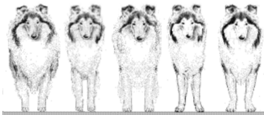
CORRETO ESTREITO LARGO VALGO FRENTE FRANCESA