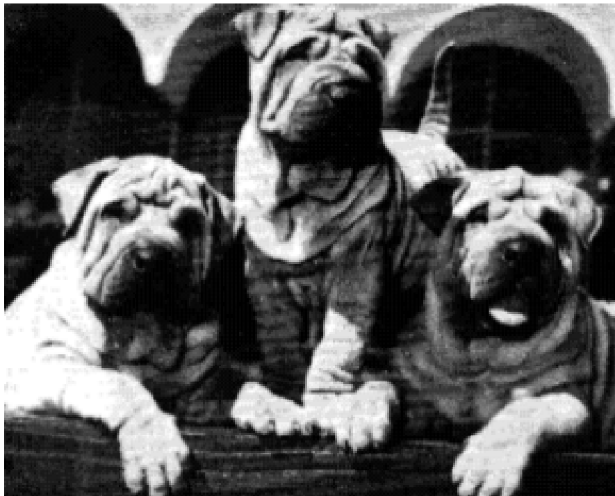
Shar Peis originários da China

ADVERTÊNCIA: qualquer alteração física artificial no SHAR PEI (particularmente nos lábios e pálpebras) elimina o cão da competição.