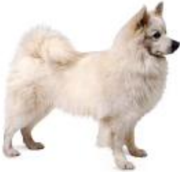
Spitz Alemão Grande