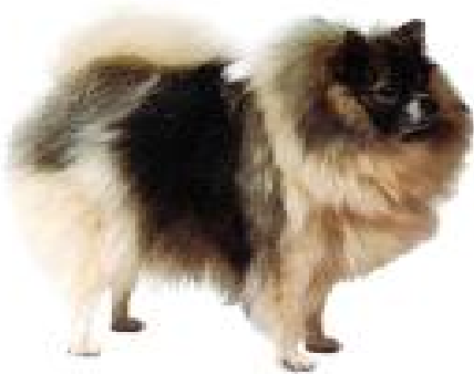
Spitz Alemão Pequeno