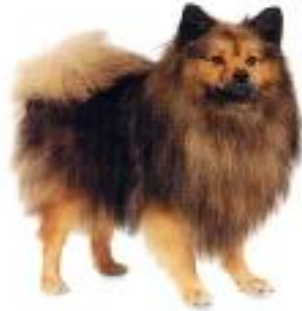
Spitz Alemão Médio